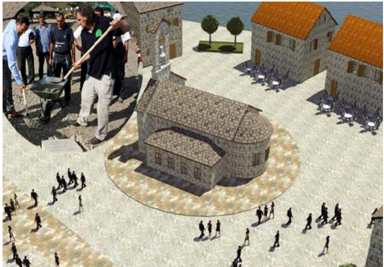
1-3 Recreacions digital d'Andrićgrad