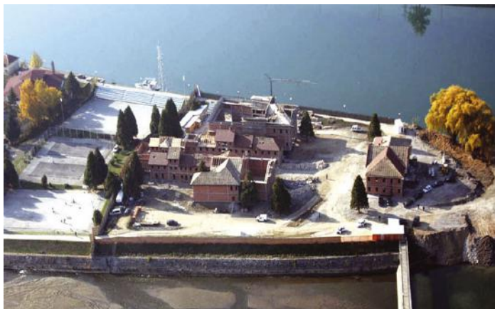
1 cartell del projecte d'Andrićgrad amb fotografia d'Ivo Andrić 2 Andrićgrad, 2012 3 Andrićgrad, 2012