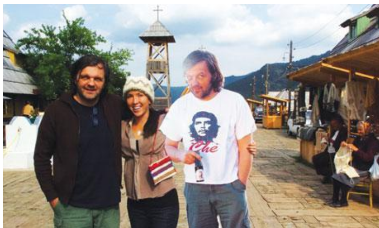
1 Maqueta del poble de Drvengrad 2 Drvengrad, 2006 3 Foto turística amb Emir Kusturica, 2006